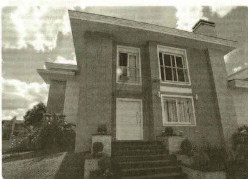
Detalhes de friso e apliques em madeira na porta feita sob medida pelo escritório Lupatini, Lima, Ramos.

lhes aplicados e em dimensões maiores do que as convencionais, além do formato pivotante. Nesse modelo em que a porta gira em um eixo vertical, fixado no piso e no teto, as ferragens ficam escondidas para fora, permitindo opções de estruturas maiores e mais pesadas do que as convencionais. O arquiteto Jorge Elmor acredita que o mercado brasileiro ainda apresenta poucas soluções para portas, se comparado ao mercado americano e europeu. "Porém, já evoluímos bastante em ferragens, tipos de abertura, de vidro, isolamento e materiais utilizados. Houve melhorias no desenvolvimento em esquadrias de PVC e uma grande evolução nas de alumínio. A esquadria em madeira maciça é a